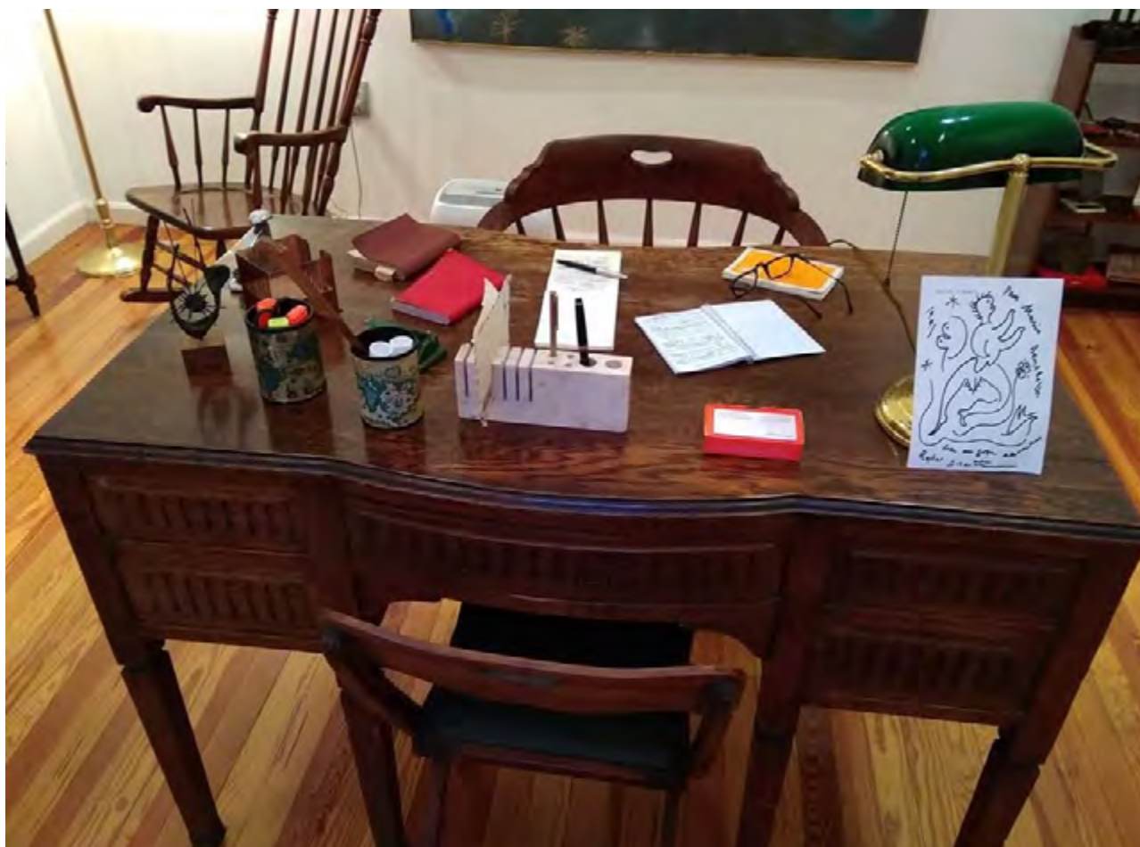
Escritorio de Mario Benedetti en el Museo de su Fundación. Montevideo, Uruguay.

escuchaba gracias a cantantes como Nacha Guevara y tantos otros que ponían música a sus versos. En el fondo de sus voces resonaba la del poeta que decía "Hagamos un trato", y yo lo hice con su poesía. Porque desde entonces, sus versos siempre me acompañaron. Los utilizaba en mis clases de español lengua extranjera con enorme éxito y asombro de los estudiantes. El poema Te quiero "porque sos, / mi amor, mi cómplice, todo, / y en la calle codo a codo / somos mucho más que dos" es uno de los más simples y a la vez más profundos y emotivos poemas de amor que se hayan compuesto en ese maravilloso "español de América" con resonancias del Siglo de Oro.